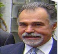
Dr. Javier Torres Nafarrate

problemáticas y políticas de la población indígena en México , México, Miguel Ángel Porrúa/UTO.GRAPO/UNFPA/ Universidad Autónoma del Estado de Hidalgo, 2012, pp. 11-32.